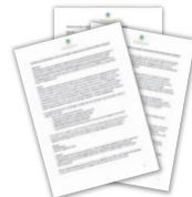
Vragenlijsten met toelichting voor het gebruik in de praktijk