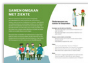
Gesprekskaart om communicatie te faciliteren